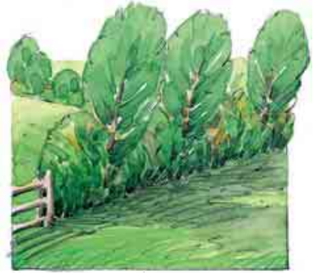
Zuhaitz eta zuhaisken nahasketa.

Landare-hesien altuera, dentsitatea, egitura eta landare konposaketa asko aldatzen da helburuen arabera: itxitura, haizearekiko babesa, lurraren babesa, gune hezeen saneamendua, abereen elikagai osagarria, ezti edo fruitu zein egur iturri eta abar. Orokorrean, funtzio desberdinen konbinaketa betetzen dute.