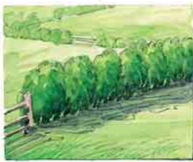
Zuhaiskez soilik osatutakoa.

Landare-hesia osatzen duten zuhaitz eta zuhaisken arabera, hiru mota nagusi aurki ditzakegu: